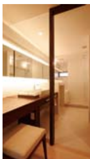
狭くなりちなサニタリーは、素材を工夫して明るくオープンスタイルに。鏡で空間を広く見せる工夫も浴室・洗面 / 部分費用・180万円