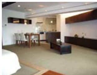
引き戸を開ければ、LDKと寝室が一体化する開放的な間取り。造作家具はダークブラウンで統一 LDK / 部分費用・350万円