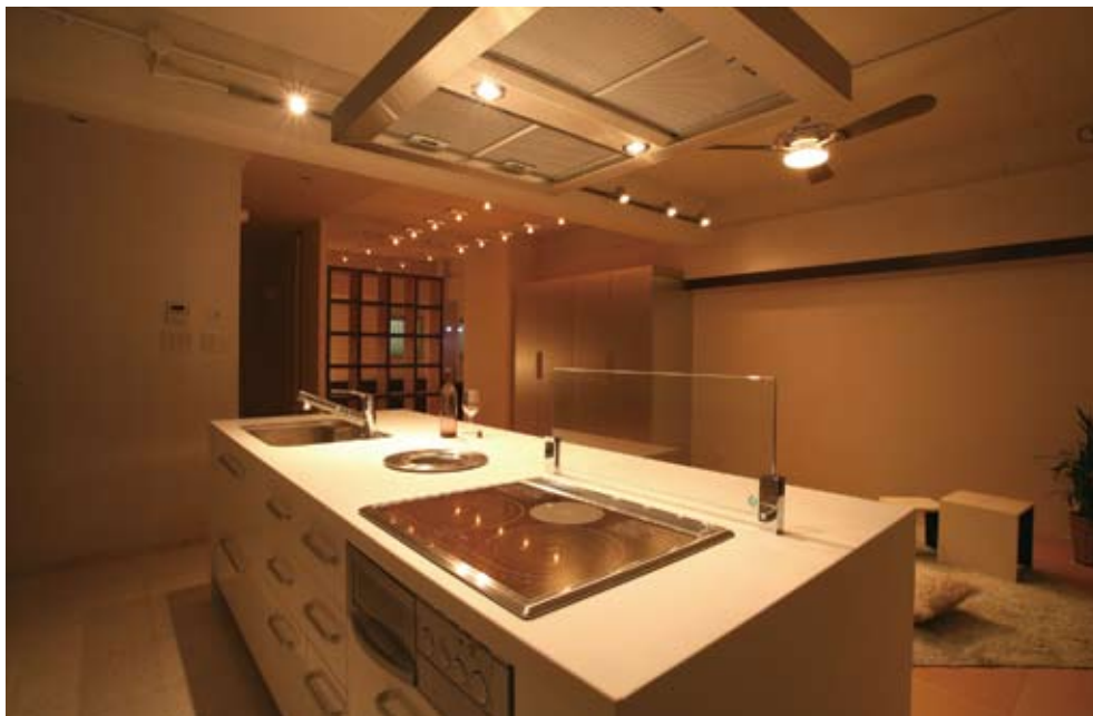
「お客様を招いてパーティができるように」と考えられたリビングダイニング。主役はもちろんアイランドキッチン。まるで家具のような端正さと重厚感が魅力だ。キッチンツールを入れる大収納も、シルバーで統一感を出している LD / 部分費用・300万円