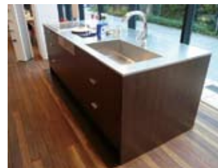
オーダーメイドのキッチン。ウエンゲ色のキャビネットに、ステンレスのワークトップを キッチン / 部分費用・120万円